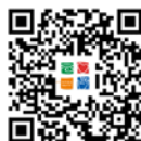
「职安健 2.0」流动應用程式