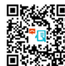
网上职安健投诉表格

如有任何关于工作地点的不安全作业模式或环境状况的投诉，请致电劳工处职安健投诉热线 2542 2172 或在劳工处网站填写并递交网上职安健投诉表格。所有投诉均绝对保密。