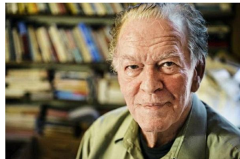
顏色革命之父 基恩·夏普 (Gene Sharp)