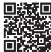
網上職安健投訴表格

如有任何關於工作地點的不安全作業模式或環境狀況的投訴，請致電勞工處職安健投訴熱線 2542 2172 或在勞工處網頁填寫並遞交網上職安健投訴表格。所有投訴均會絕對保密。